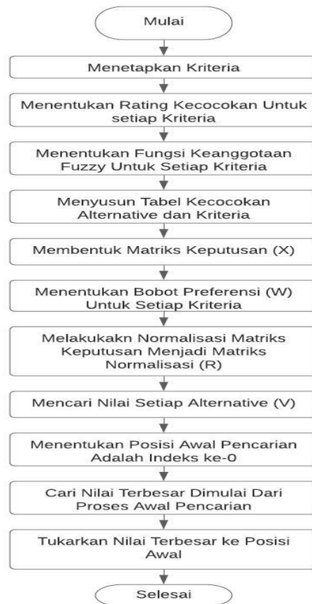
Gambar 1. Flowchart Penelitian